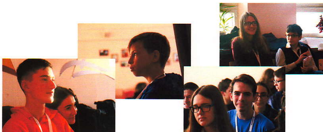
Слёт активной молодежи (ноябрь 2017)