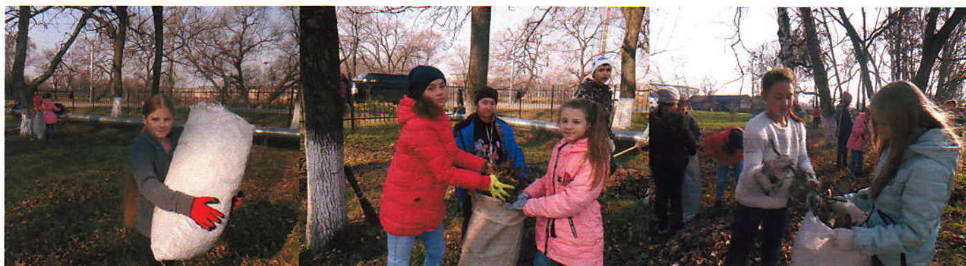
Экологический субботник (октябрь 2017г.)