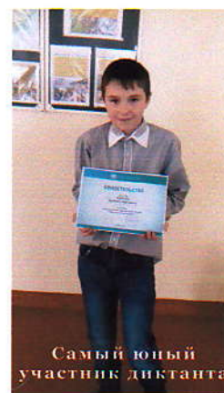
Самый юный участник диктанта