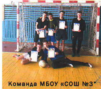
Команда МБОУ «СОШ №3»