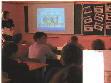
Классные часы в 7в, 11 и в 9в классах