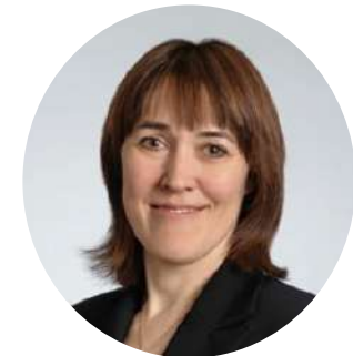
Замглавы Минобрнауки России Петрова О.В.

Реализуемая система федеральных инновационных площадок Минобрнауки России сегодня оказывает всестороннюю поддержку педагогическому сообществу – реализуемая инновационная площадка выступает организатором профессиональных конкурсов и мероприятий, разрабатывает педагогические учебники и пособия, оказывает информационную, правовую, методическую и информационную поддержку работникам образования и реализует и иные важные задачи в системе образования.