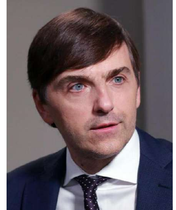
Министр просвещения РФ Сергей Кравцов