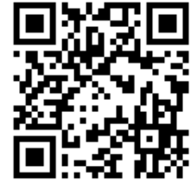
Единый календарь образовательных событий Минпросвещения России

Среди организаторов событий, размещенных в календаре, педагогические вузы Минпросвещения России, Московский государственный университет имени М.В. Ломоносова, АНО «АПГИ» и другие организации.